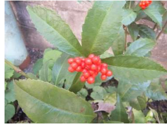
↑センリョウの赤い実がたくさんつきました！

あい・ぽーとでは 化学肥料 や農薬を使わない方法 でい ろんな野菜やハーブを育て ています。