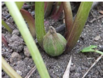
↑フキノトウが出始 めています！