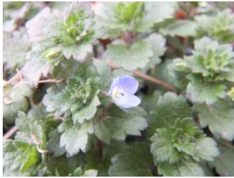
↓オオイヌノフグリ