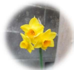
↑スイセンのお花 香りがとても良いです♪