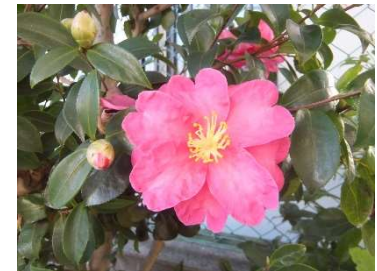
↑園庭の西側でサザンカ のお花がたくさん咲い ています♪