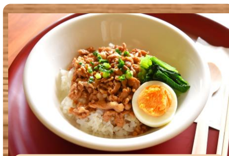
豚丼 温野菜を添えて