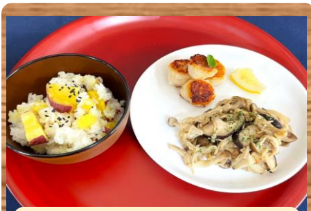
れんこんボールとキノコ炒め さつまいもご飯を添えて