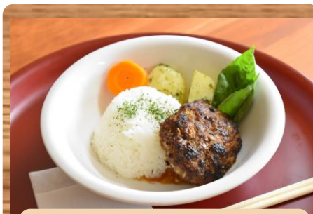
麺ハンバーグ 温野菜を添えて