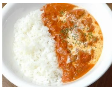
バターチキンカレー